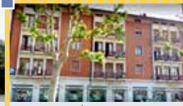
GOXU S.R.L. ITALYA